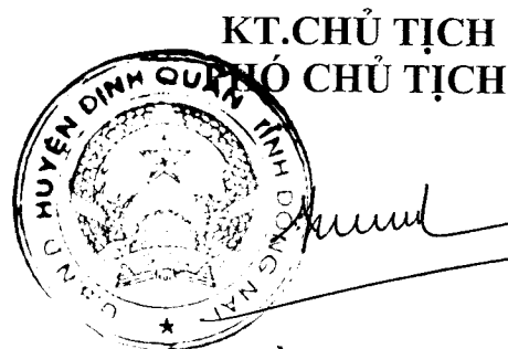
Trần Nam Biên